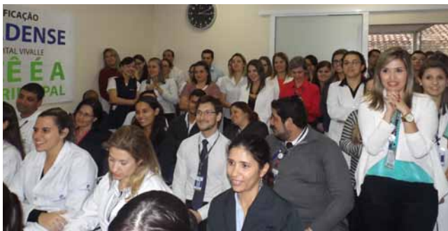
A ansiedade antes da conclusão do relatório deu lugar à alegria com o retorno positivo

No dia 10 de setembro, os representantes do IQG voltaram ao Hospital para a cerimônia de entrega da placa comemorativa que marca a conquista da Certificação Diamante da Accreditation Canada International (ACI) .